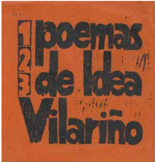
Proyectos para la carpeta.