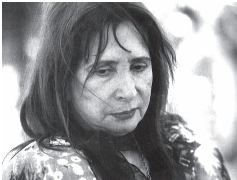
Marosa di Giorgio

co ejemplares impresos en papel, acompañados del soporte electrónico correspondiente.