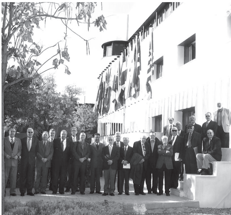
Presidentes y Directores de las Academias en el Centro de Estudios, Madrid.

Las sesiones se desarrollaron en la sede de la Real Academia Española, de la calle Felipe IV, donde fueron inauguradas las nuevas dependencias de la Asociación de Academias. Los académicos hispanoamericanos visitaron también el Centro de Estudios de la Real Academia Española y la Asociación de Academias, sito en la calle Serrano 189, y recorrieron los distintos departamentos de trabajo.