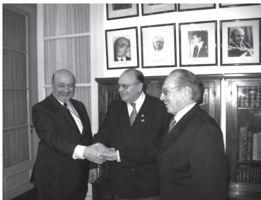
Los tres Presidentes Académicos, después de firmar el documento

4. En particular, en momentos en que se han tensado las relaciones entre dos países tan próximos como son Uruguay y la Argentina, las Academias proponen un lema: “La lengua y la literatura son puentes”.